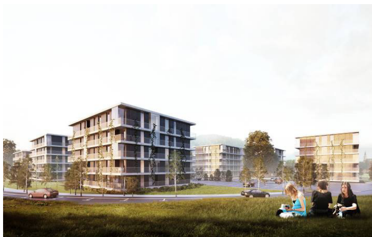
(Kranj – Ob Savi)

V soseski sta predvideni dve igrišči, od tega eno otroško igrišče za manjše otroke in eno športno igrišče za mladostnike, družabni prostor s slaščičarno ter povezava kolesarske poti ob Savi. Območje odlikuje izjemna pozelenelost robov, neposredna bližina reke Save in obrečnega prostora ter neposredna bližina mestnega jedra, naselja Čirče ter industrijskega zaledja preko reke.