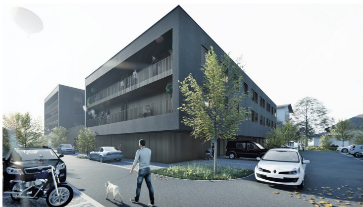
(Ljubljana – skupnost za mlade Gerbičeva)

V objektu je predviden Medgeneracijski center s skupnim večnamenskim prostorom, kuhinjo z jedilnico ter dnevno sobo, pisarno in servisnimi prostori z ločenim vhodom in dostopom v atrij. S preprostimi funkcionalnimi rešitvami se v novih objektih zagotavlja maksimalna kakovost bivanja. Razvejana zasnova omogoča oblikovanje stanovanjskih enot, prilagojenih potrebam mladostnikov.