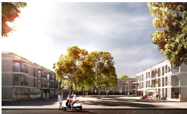
(Maribor – Pod Pekrsko gorco)

V sklopu stanovanjske soseke je predvidena tudi umestitev dveh stavb s skupno 60 oskrbovanimi stanovanji, dnevnega centra aktivnosti za starejše ter javnega programa v delu pritličjih objektov, predvidoma trgovske in storitvene dejavnosti. Koncept ureditve prometa v naselju daje prednost stanovalcem in kolesarjem. Zasnova omogoča v notranjosti naselja ureditev večjih in med seboj povezanih in programsko ustreznih zelenih in tlakovanih površin (urbani parki, igrišča za otroke, igrišča za mladostnike) ter zasaditev z rastlinami in mirnejši program v notranjih atrijih posameznih karejev.