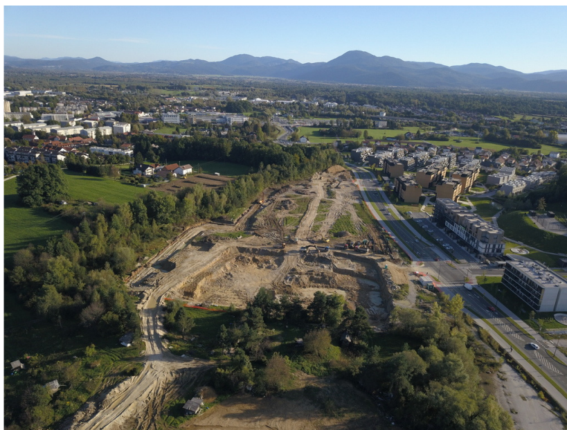
(Območje urejanja: Ljubljana - Novo Brdo)

Območje Novo Brdo, ki je namenjeno gradnji najemnih stanovanj, se nahaja v Ljubljani na Viču, vzhodno od nove povezovalne ceste Pot Rdečega križa ter med Cesto na Vrhovce in Cesto na Brdo. Nasproti območja, kjer se načrtuje nova soseska, je že zgrajena soseska Zeleni gaj na Brdu (območje Brdo VS3/5) s 641 stanovanjskimi enotami, katerih investitor je bil Sklad. Za sosesko Novo Brdo je bil sprejet in objavljen prostorski akt OPPN 252 v Ur. l. RS, št.: 75/17, dne 22. 12. 2017.